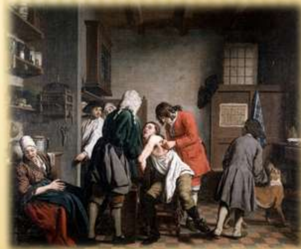
Врачевание в эпоху Средневековья